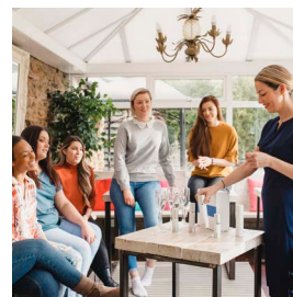
VENTAS DIRECTAS/ VENTAS LIBRES