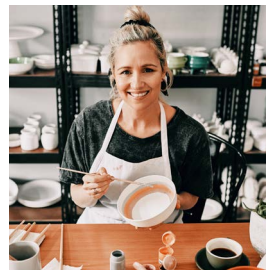
ACTIVIDADES SECUNDARIAS CON INGRESOS ADICIONALES