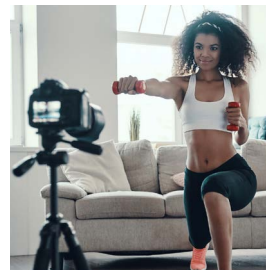
NEGOCIOS CON ESTILO DE VIDA