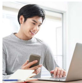
TRABAJO A DISTANCIA

El mundo ha experimentado cambios monumentales y de igual manera ha cambiado nuestra forma de concebir el trabajo. En lugar de las rutinas aburridas, el tráfico desquiciante y las oficinas repletas de cubículos, las personas se han abierto a nuevas posibilidades para ganarse la vida. Ahora ya no buscan simplemente tener un trabajo para pagar las cuentas, sino contar con un medio gratificante para mantener a sus familias. Continúan buscando seguridad, pero quieren una forma de alcanzarla que tenga sentido, que aporte valor a los demás y permita la expresión personal. Esto ha creado un panorama de oportunidades gracias a tendencias que evolucionan de forma rápida como las siguientes: