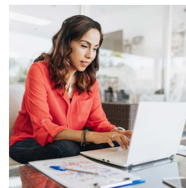
NEGOCIOS EN CASA