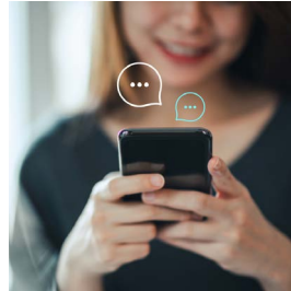
MARKETING EN REDES SOCIALES